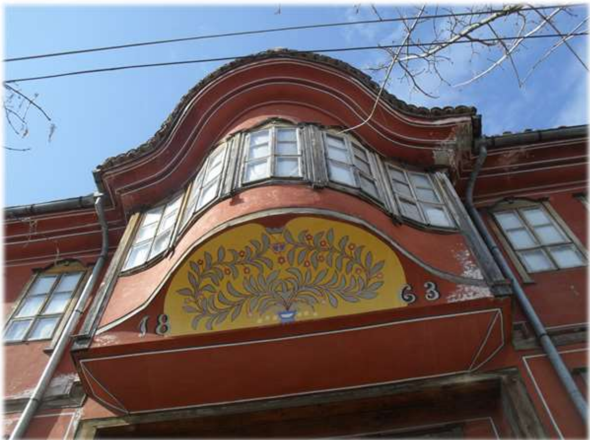
Хаджиангеловата къща, строена през 1863 година на ул. »Раковски« - днес е Етнографски музей

Така както аз се гордея с моя прапрадядо, така след време искам и с мен да се гордят моите роднини.