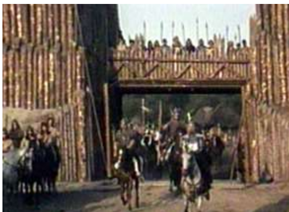
Снимки от филма „Земя завинаги“