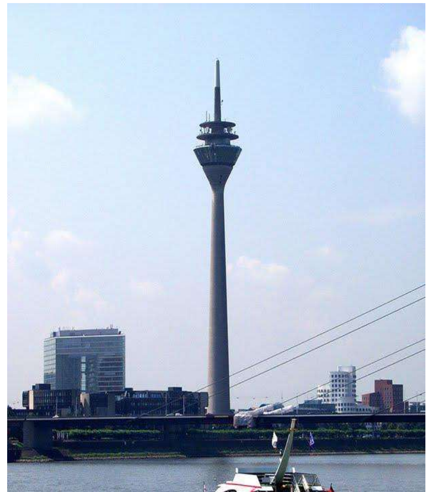
Rheinturm (240 Meter)