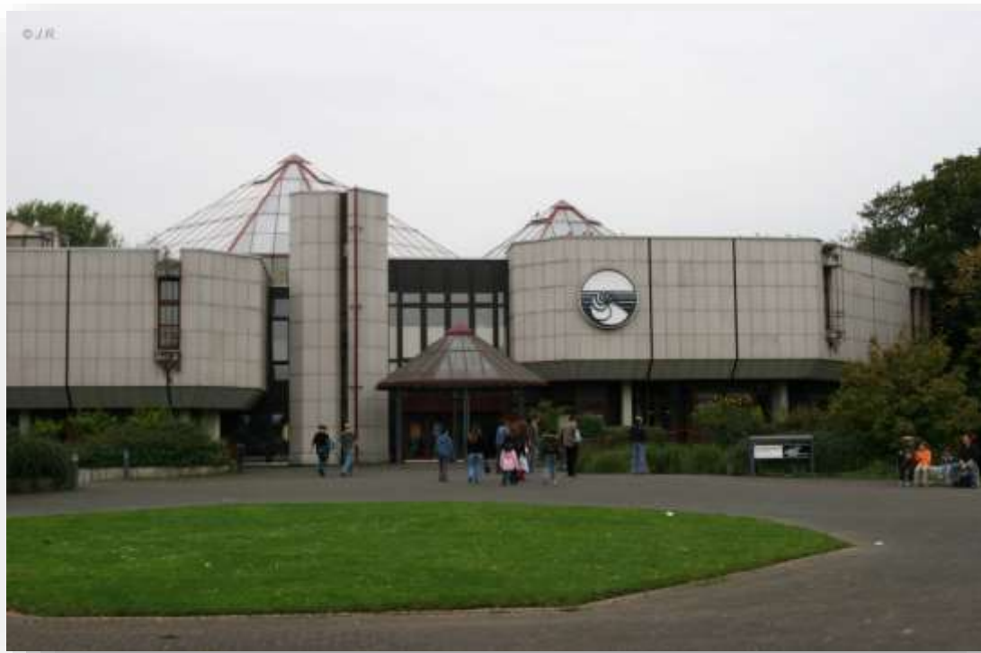
Meistbesuchtes Museum ist der Aquazoo im Nordpark.