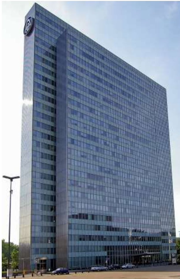
Dreischeibenhaus( 94 Meter)